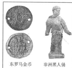
一组: 唐朝墓葬出文物