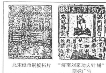
二组: 宋代留存实物