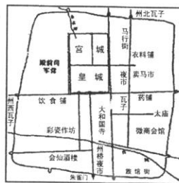
图二 宋代东京城平面图