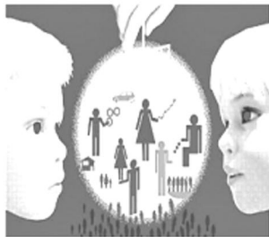
从摇篮到坟墓的福利