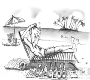
福利国家培养懒汉