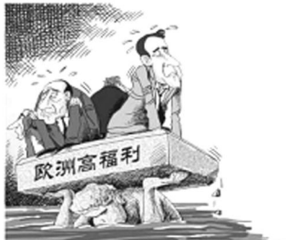
高筑债台支撑福利