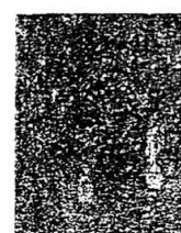
C. 阎立本《历代帝王图》