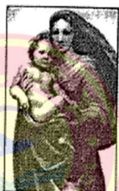
拉斐尔的《西斯廷圣母》