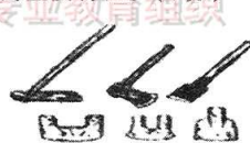
战国时期的铁制农具