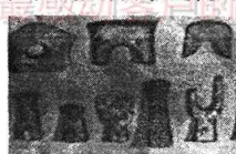
商周时期青铜器工具