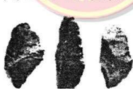
北京人制作的石器

(4)三组同学收集到下面一组图片,据此说明我国古代经济发展的主要特征。(4 分)