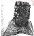
河姆渡出土的骨耒耜