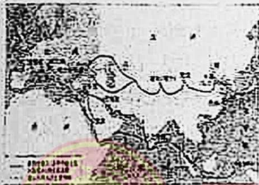
图一 14世纪亚欧商路图

16. 时空观念是指事物与特定时间及空间的联系进行观察, 观察图片, 回答问题。