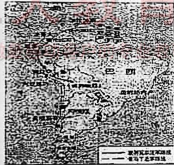
图四南美独立形势图