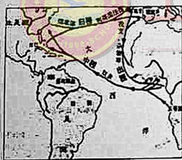
图三 “三角贸易” 路线图