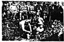
图三 日军活埋南京和平居民