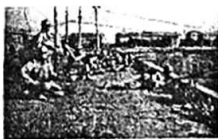
图一 日军占领沈阳