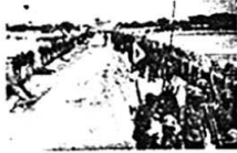
图二 日军占领卢沟桥