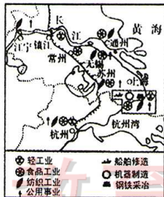
图二 民国初年江浙民族工业分布图