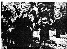
德国法西斯迫害犹太人