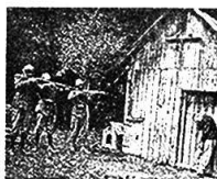
意大利军人屠杀平民