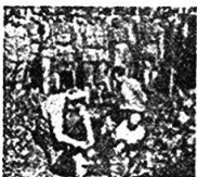
日军屠杀中国公民