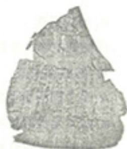
图 6 刻有文字的甲骨