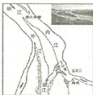
图 7 都江堰示意图