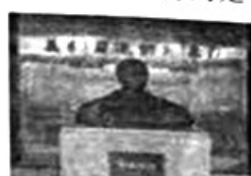
D. 天津义和团纪念馆

8. 19世纪末,列强在中国掀起强租租借地和划分“势力范围”等瓜分中国的狂潮。面对这一现状,美国采取的措施是