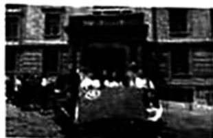
北京·新文化运动纪念馆