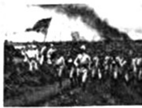
图三 八国联军在大沽登陆