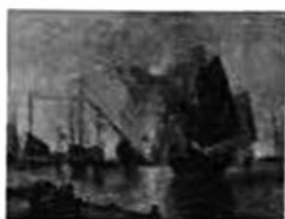
图一 英国炮轰广东海面