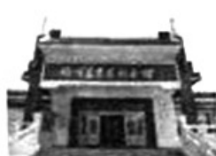
C. 旅顺万忠墓纪念馆