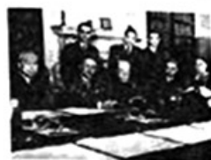
图一 北洋政府祭天活动 图二 巴黎和会中国代表