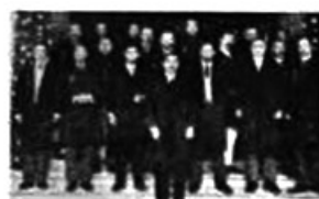
图1 黄花岗七十二烈士墓 图2 武昌起义(浮雕) 图3 同盟会成立(油画) 图4 孙中山就任临时大总统