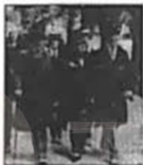
图一 巴黎和会三巨头 (劳合·乔治、克里孟梭、威尔逊)

(2)照片见证历史事件发生的瞬间。概括下面照片所反映两次会议的相同之处。(4分)