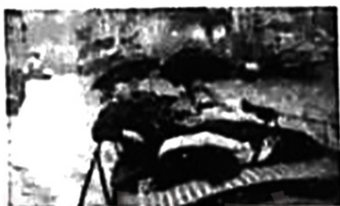
图二 机器时代的“享受”