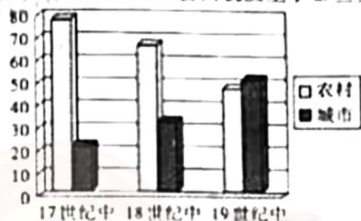
图一 英国城市人口与农村人口比例

(2) 下图反映出英国的社会面貌发生了哪些变化? 你如何看待工业化带来的社会变化?