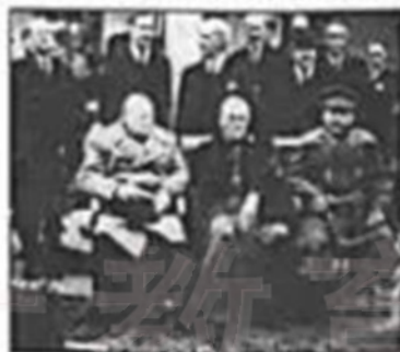
图二 雅尔塔会议三巨头 (丘吉尔、罗斯福、斯大林)

(3)歌曲反映了一定时代的价值追求。下面歌曲分别是在怎样的背景下创作的? 归纳这两首歌曲所起的共同作用。(6分)