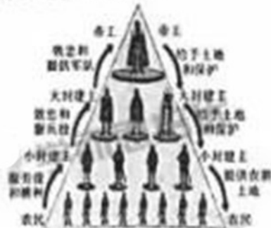
图二 西欧封君封臣制度