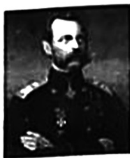
图二 亚历山大二世

材料二 这场革命的爆发是二月革命后一系列事件发展的必然结果,资产阶级临时政府为了本阶级的利益继续进行帝国主义战争……人们相信布尔什维克,认为只有推翻无能的资产阶级临时政府,建立工农自己的政权,国家才能有出路。