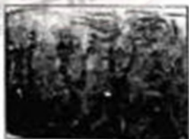
穿汉服展的南朝乐队