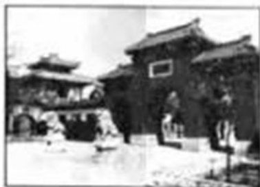
图三 河南南阳张仲景祠