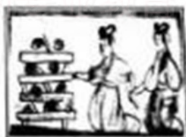
汉族妇女蒸馍与烙饼砖画