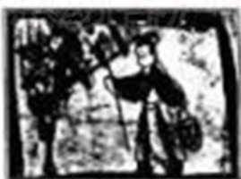
少数民族墓室壁画《采桑图》