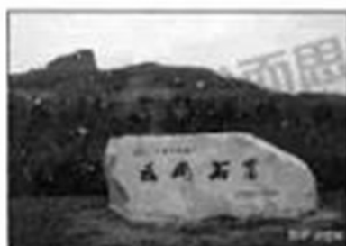
图四 山西大同云冈石窟遗址