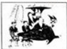
穿汉服的少数民族贵族