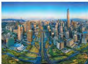
改革开放后的深圳

1984年,邓小平视察了深圳后说:“...是个窗口,是技术的窗口,管理的窗口,知识的窗口,也是对外政策的窗口...以引进技术,获得知识,学到管理,管理也是知识...成为开放的基地,不仅在经济方面、培养人才方面使我们得到好处,而且会扩大我国的对外影响。”