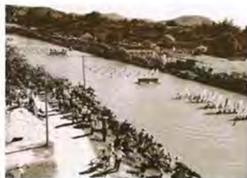
改革开放前的深圳